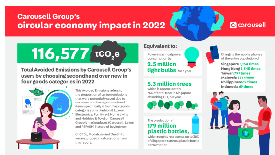
Kapsyen: Carousell menerbitkan Laporan Impak Ekonomi Sekular sulungnya dengan penemuan menunjukkan bahawa jualan dan belian barangan terpakai adalah pilihan terbaik untuk planet berbanding runcit tradisional membeli barangan baharu.